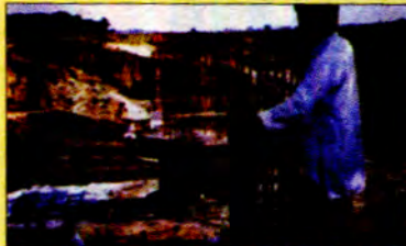
လုပ်ငန်းခွင်မှ မြန်မာအင်ဂျင်နီယာတစ်ဦး