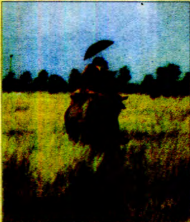
မူတ်တရက် ဆင်တစ်ကောင်ပေါ်တွင်လာသည်။ ယင်းနောက် သူတို့နှင့် မန္တန်များ ရွတ်ဆိုနေသော ဘုန်းတော်ကြီးများကို သူ့ကျောပေါ် တင်ပြီး ဗုဒ္ဓဘာသာ ဝိယက်နမ်ဘုန်းတော်ကြီးကျောင်း တည်ဆောက်ရန် လျာထားသော မြေတွက်ပတ်လည်ကို ညင်သာစွာ လှည့်လည်သည်