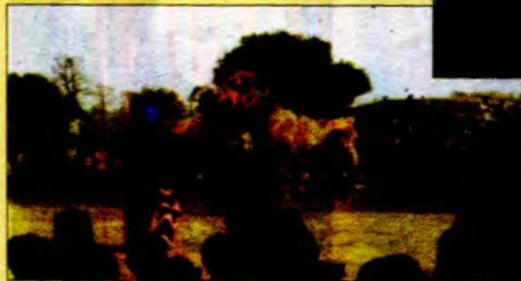
(နီပေါ)လူမှုနိဂ္ဂို မေတ္တာတံတား တည်ဆောက်ပြီးနီးခြင်း အခမ်းအနား