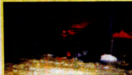
ထွက်ပြုစေနေမင်းကိုကြည့်ရင်း တဲအနီးမှာထိုင်ခြင်း