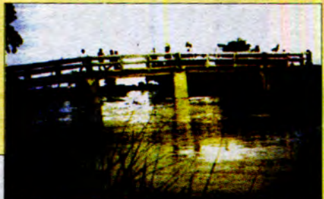
မေတ္တာတံတားက ထူးခြားတဲ့ဩဇာပေးပြီးနီးခဲ့သည်