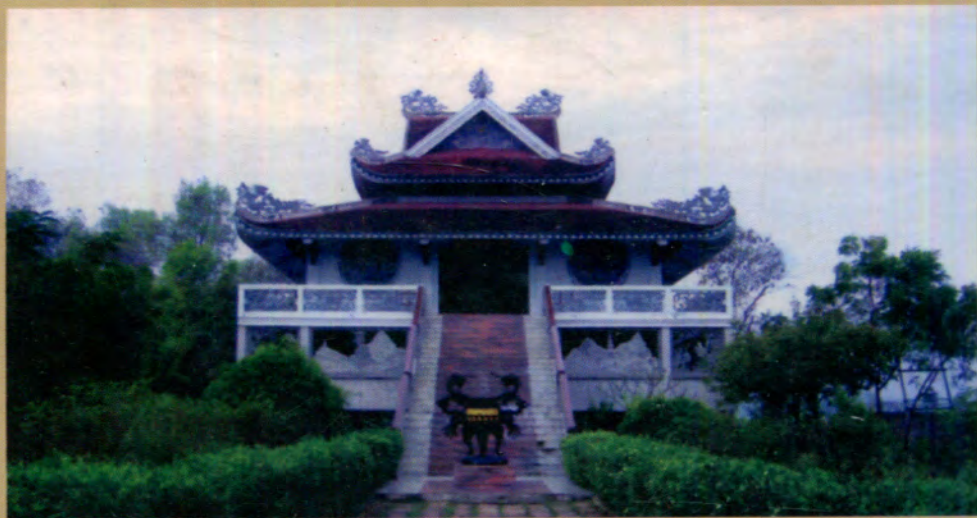
အိန္ဒိယနိုင်ငံ၊ ဗုဒ္ဓဂယာတွင် ဝိယက်နမ်နိုင်ငံမှ တည်ဆောက်သော ဗုဒ္ဓဘာသာဘုန်းကြီးကျောင်း