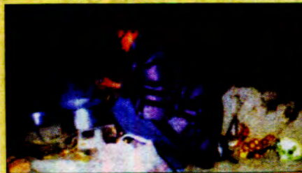
အလွန်ချမ်းအေးလှသော ဆောင်းရာသီ အအေးမာတ်ကို စောင်တစ်ထည် လွှမ်းပတ်လျက် အံ့တရသည်။