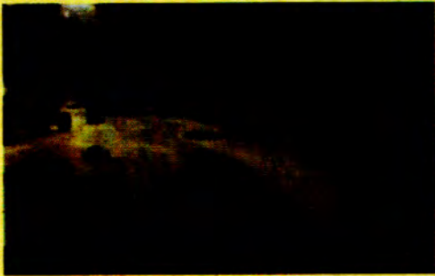
နီပေါလမ်းများပေါ်မှ စစ်၏အနိဗ္ဗာန်များ