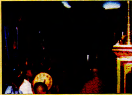
ဝိယက်နမ်ဘုန်းတော်ကြီးကျောင်းတွင် ဒီဇင်ဘာလဆန်းလှည့်ကျ နိုင်ငံတကာ ဗုဒ္ဓဘာသာအဖွဲ့များ ဆုတောင်းပွဲ ကျင်းပခြင်း