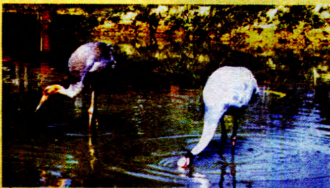
လှမွန် (နီပေါ) ဤမြေကွေး