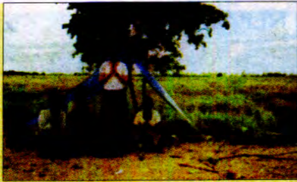
ဗုဒ္ဓဝယာမှ အိန္ဒိယမိတ်ဆွေများ ကူညီရန် လာကြသည်