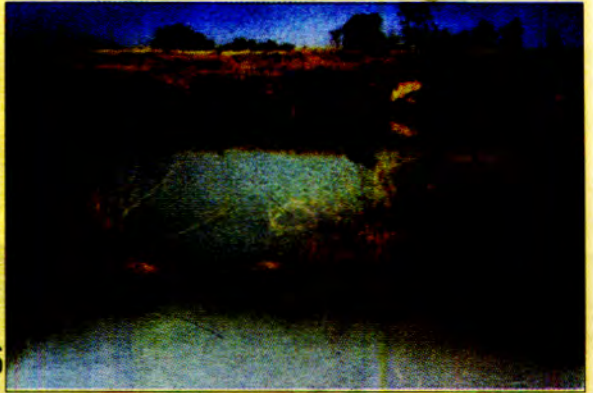
စွန်စွန်စားစားဆုံးဖြတ်ချက်