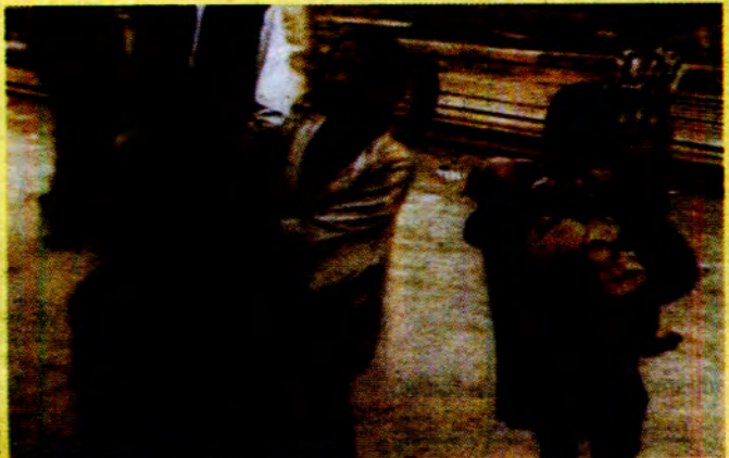
စစ်နှင့် ဆင်းရဲမွဲတေမှု