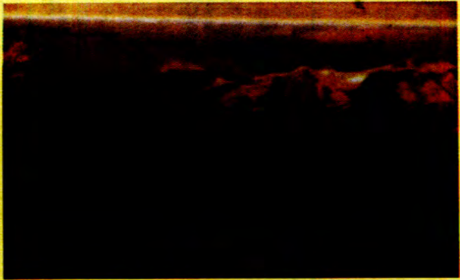
ဆွဲဆောင်မှုရှိသော အလှအပများနှင့် နီပေါနိုင်ငံ