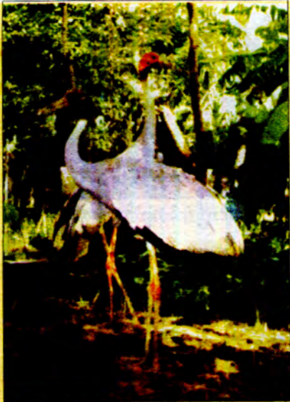
အရပ်ရပ်တွင် အကောင်ကြီးကြီး ငှက်ကြီးများ ကျွန်တော်တို့ရဲ့တွင် ပထမဆုံးအကြိမ် မြင်လိုက်ရချိန်က ကျွန်တော် ဆုံးအားသင့်သွားခဲ့ရသည်