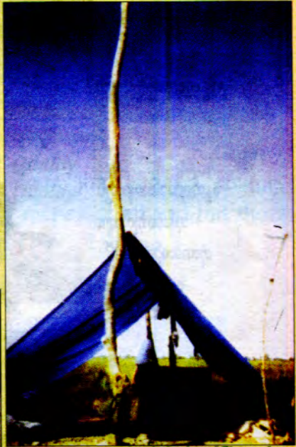
လုမ္ဗိုတွင် ဗုဒ္ဓဘာသာ ဝိယတ်နမ်ဘုန်းတော်ကြီးကျောင်း ဆောက်လုပ်စေနေရက်များ