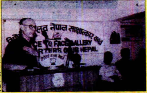
ဒီဇင်ဘာလဆန်းလှည့်ကျတွင် ပြန်လည်သင်မြတ်ရေး မိန့်ခွင့်ပြောစဉ်