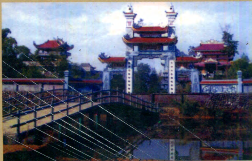
လုမ္ဗနီ ဥယျာဉ်အတွင်း ဝိယက်နမ်နိုင်ငံမှ တည်ဆောက်သော ပထမဦးဆုံး အပြည်ပြည်ဆိုင်ရာ ဗုဒ္ဓဘာသာဘုန်းကြီးကျောင်း