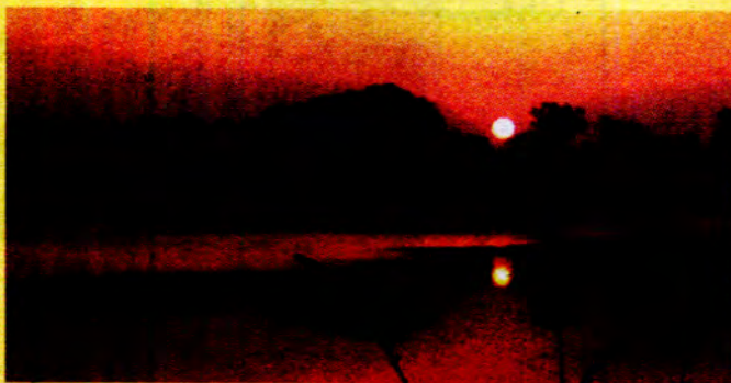
လှမွန် (နီပေါ)မှ နေဝင်ချိန်ရှုခင်း