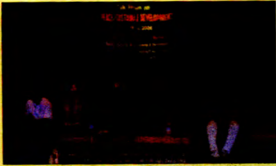
ခတ္တမန် ဒုဗ္ဗိ တွင်ကျင်းပသော ဒီဇင်ဘာလဆန်းလှည့်ကျ ဝတ်စုံပြပွဲတွင် လူငယ်ကလေးများကလေးများနှင့်