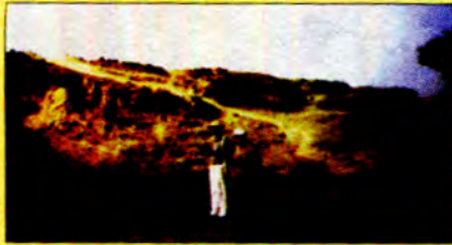
မြေတိုင်းထွာခြင်း