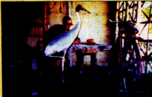
ကြိုးကြာငှက်များကို ကာကွယ်ပေးနိုင်ခဲ့သော အောင်မြင်မှုက ကြီးမားသော ပီတိကို သယ်ဆောင်လာသည်