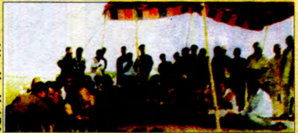
ပန္နက်ချအခမ်းအနားတွင် ဘုန်းတော်ကြီးများ ထုံးတမ်းစဉ်လာအတိုင်း လုပ်ဆောင်နေစဉ်