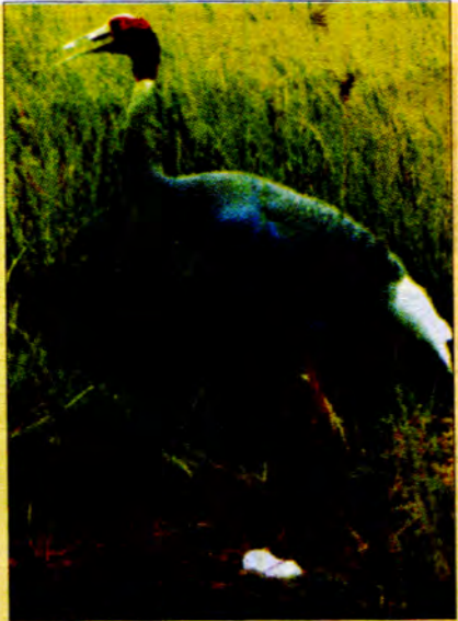
ကြိုးကြာငှက်တို့ကို ဘေးမဲ့ဒေသနှင့် လူအများအား တိုက်တွန်းသော ကြေညာချက်ကို ပြင်ဆင်နေစဉ်