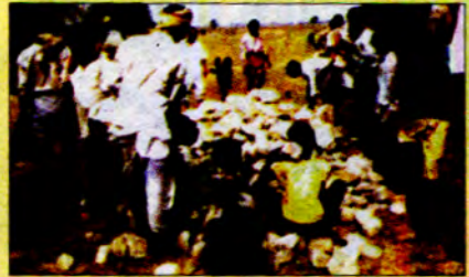
လူတိုင်း၊ လူကြီးများရော ကလေးများပါ ကူညီကြသည်