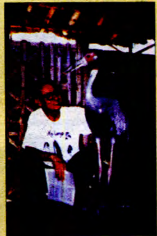
ကြိုးကြာမိသားစုမှ နောက်ပေါက်နှစ်ကောင်