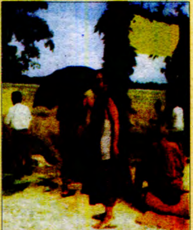
မြန်မာဘုန်းတော်ကြီးများက စိတ်အားထက်သန်စွာ ကူညီပေးကြသည်