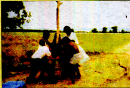
ဆရာတဝည့်များ တိုင်ထူနေစဉ်