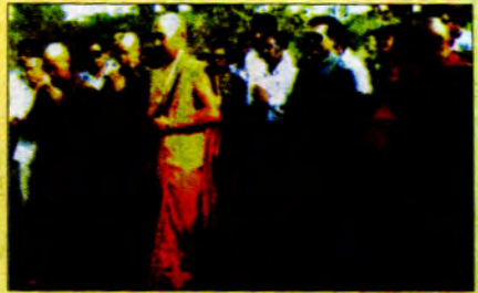
မြေစူးသည့်အခမ်းအနားကို ဆရာတော်များ စတင်ခြင်း