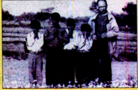
ဟူယင်ဂျူး ဒိုင်းယုနှင့် ဒီဇင်ဘာလဆန်းလှည့်ကျတွင်