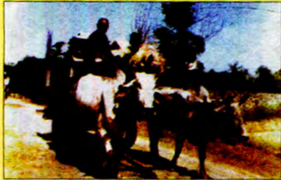
ခွားလှည်းဖြင့် သယ်ယူခြင်း