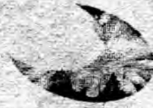
အတိုတ်ဆီနေစွဲများ

‘ကျွန်မက ခင်ခင်လေးပါ၊ သူက နွဲ့ရီပါ၊ သူငယ်ချင်း တွေလေ၊ အခု ကိုဝေမင်းကို ကျွန်မတို့ကလည်း ခင်ပါတယ်၊