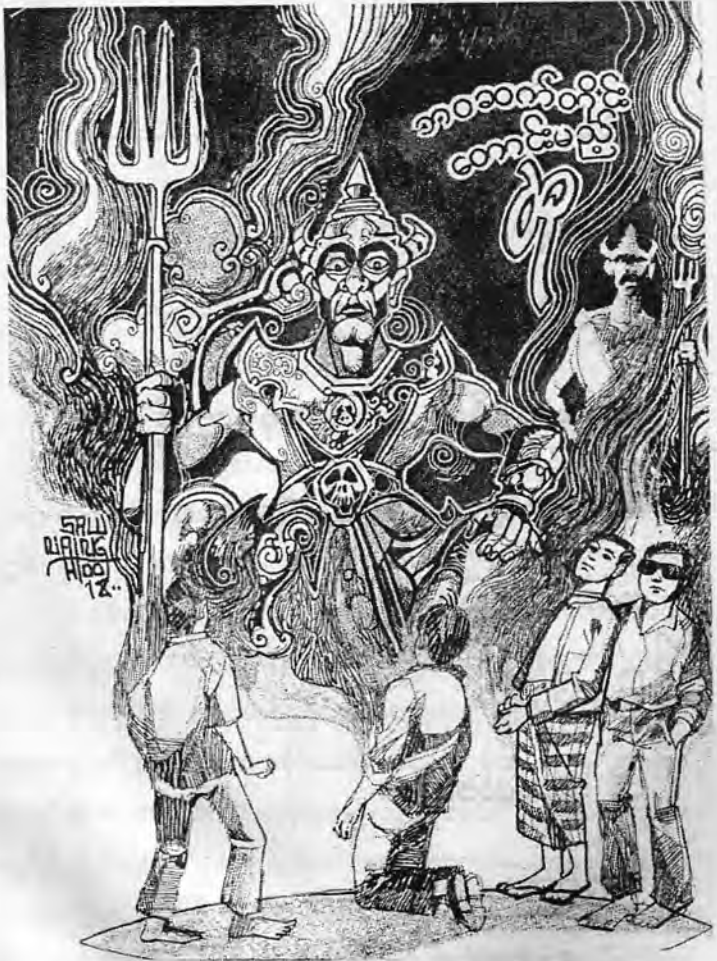
ဝမ်းလန့်ကျွန်ုပ်တို့ပေပြိုင်ပွဲတွင်တိုင်းချစ်(စာအုပ်တစ်ယခု)