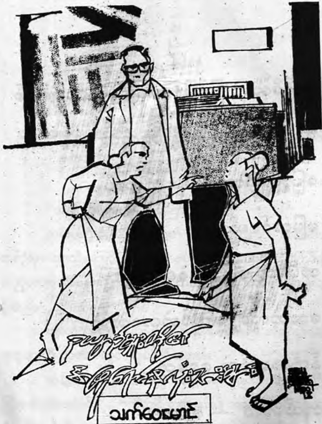
(၁၂) ငြိမ်းမြောက် ကျိက္ကလာ အထူးထောက် တက္ကသိုလ် (တတိယဆင့်)