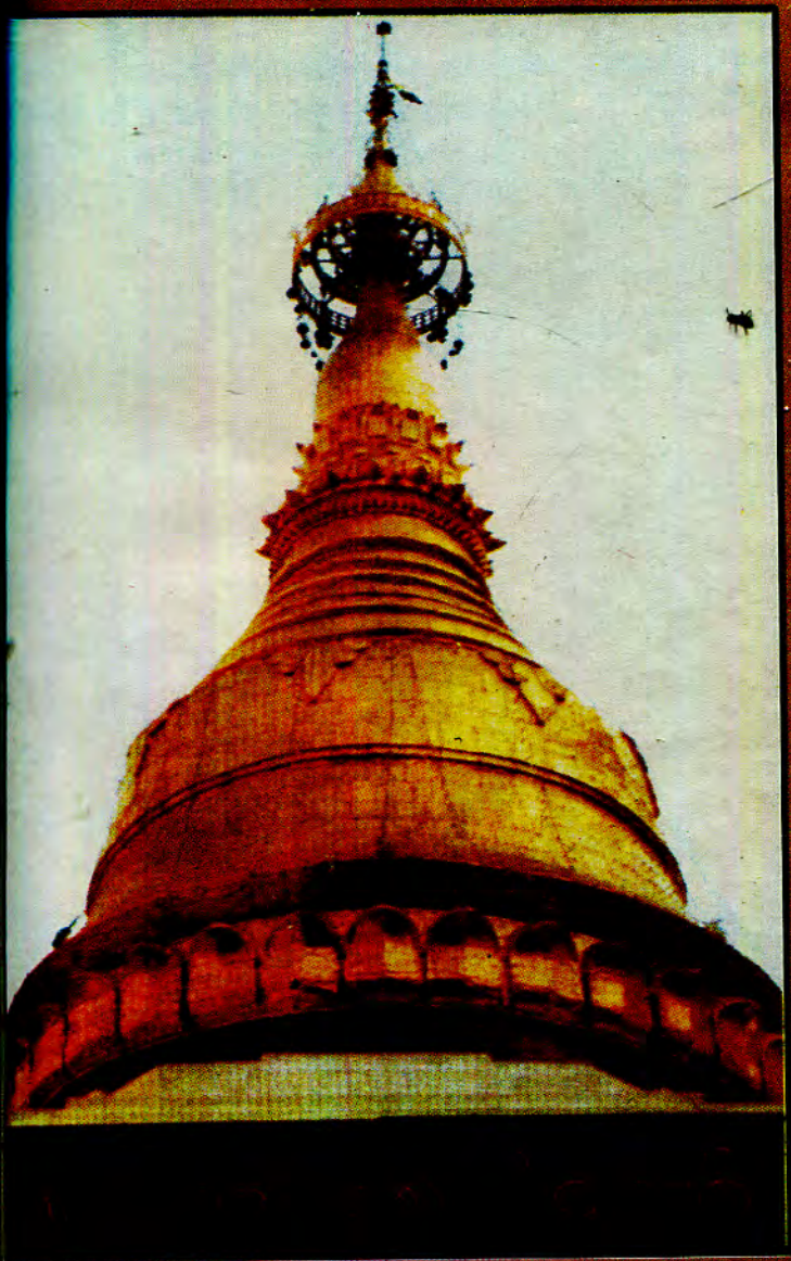
ရှင်စောပုစေတီတော် (ရှင်ကုန်မြို့စမ်းဆောင်းရပ်)