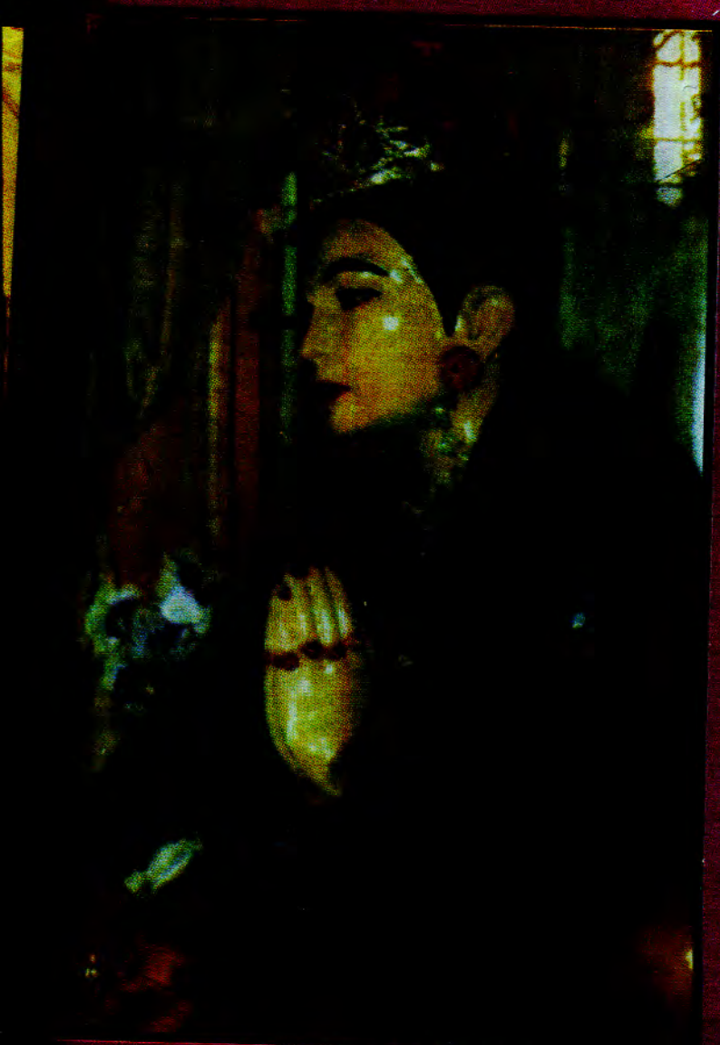
ဘုရင်စုရှင်စေတီ ၁၉၀၆ ခု၊ ဇူလိုင်လ၊ ရန်ကင်းမြို့၊ (ဝမ်းစုရှင်စုရှင်စေတီစေတီအောင်အောင်မြို့နယ်)