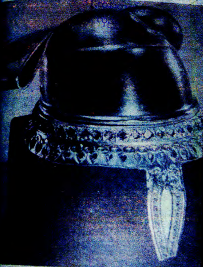
ရှင်စောပု ဘုရင်မ၏ ဓမ္မမြင်အတိပြုံးစသာ ခေါင်းစောင်တော်

ရှင်စောပုဘုရင်မ၏ ဓမ္မအတိပြုံးစသာ ခေါင်းစောင်တော်