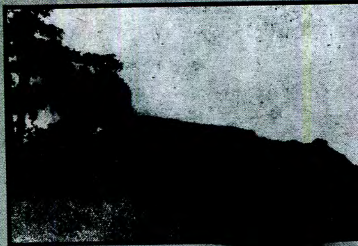
ရှင်စောပုစံနေသောဒဂုန်မြို့သစ်ပုံ