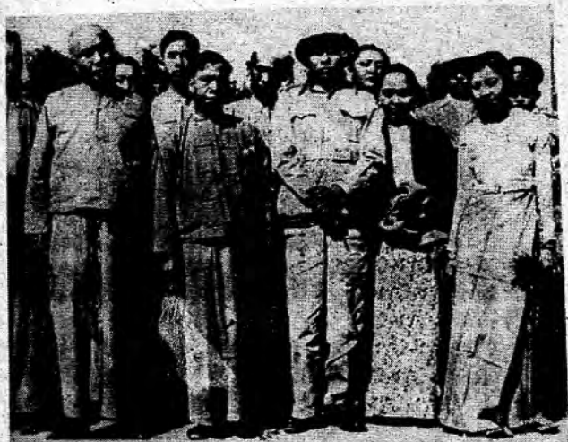
THE GROUP OF SEVEN PEOPLE STANDING IN A ROW