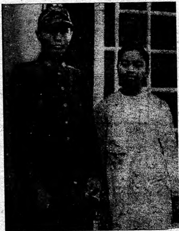
ဗိုလ်ချုပ်အောင်ဆန်းနှင့်ဗိုလ်ချုပ်ကတော် မဟာသီရိသူဓမ္မ ဒေါ်ခင်ကြည် (လက်ထပ်ပြီးစ အမှတ်တရ)