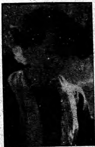
ပြည်သူလူထုကြားမှ အောင်ဆန်းစုကြည်