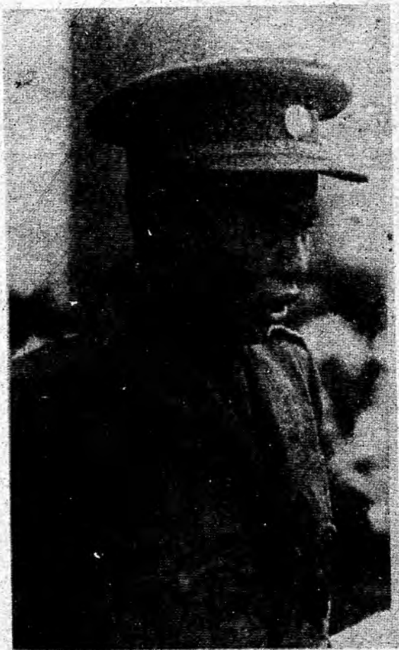
ဗိုလ်ချုပ်အောင်ဆန်း