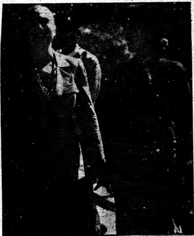
အမေရိကန် နိုင်ငံခြားရေးဝန်ကြီး ဟီလာရီကလင်လန် နှင့် အောင်ဆန်းစုကြည်