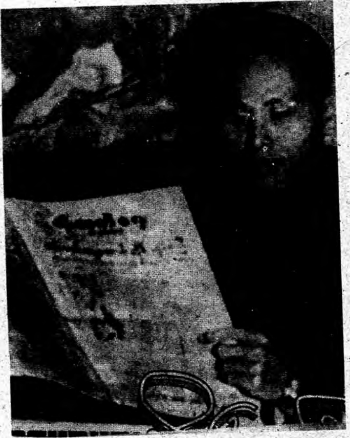
ဗိုလ်ချုပ်အောင်ဆန်း