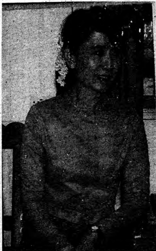
ဒီမိုကရေစီ သူမ သို့မဟုတ် အောင်ဆန်းစုကြည်