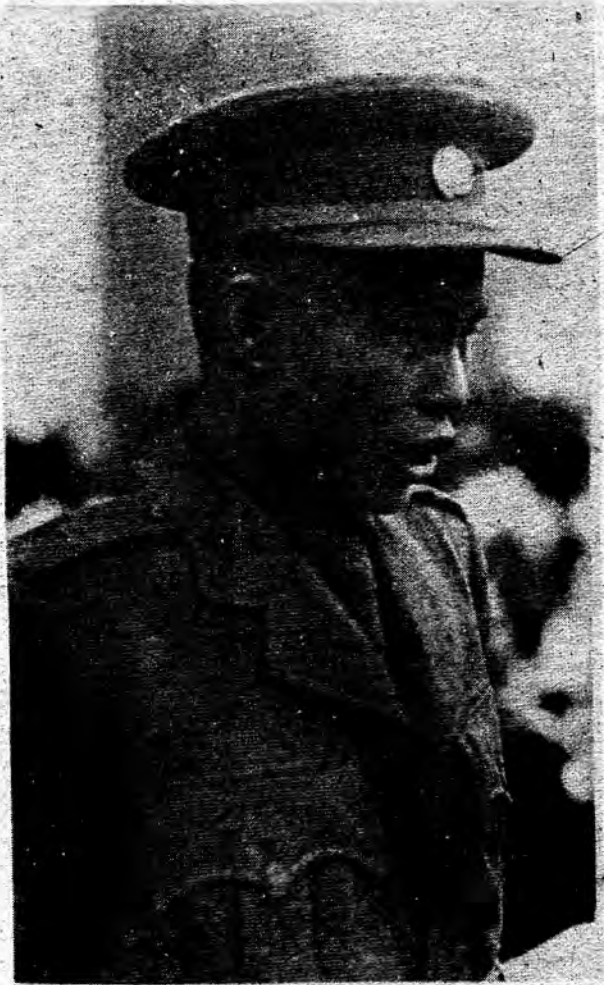
ဗိုလ်ချုပ်အောင်ဆန်း