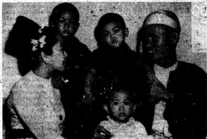
ဗိုလ်ချုပ်အောင်ဆန်းမိသားစု