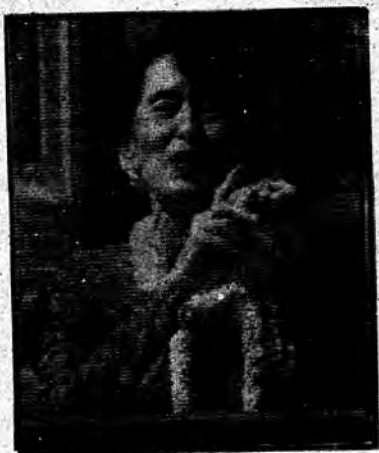
ဒီမိုကရေစီ ဖွယ်ဆောင်နေသူ ဆောင်ဆန်းစုကြည်