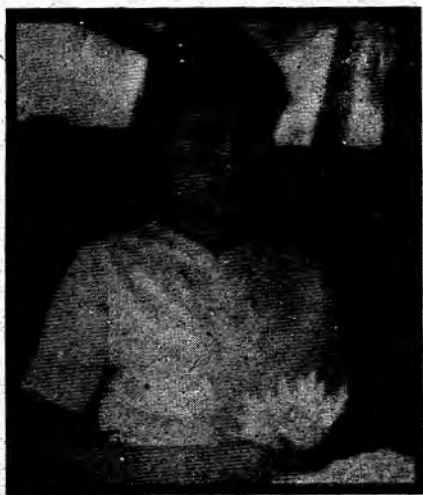
အောင်ဆန်းစုကြည် ငယ်စဉ်က နှင့် ယံခု အောင်ဆန်းစုကြည်