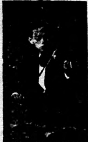
၁၃ ခြင်္သေ့မ