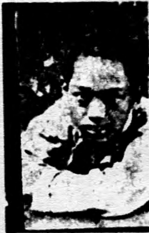
၁၆ ခြင်္သေ့မ