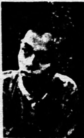
၁၄ ခြင်္သေ့မ