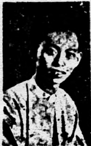
၁၅ ခြင်္သေ့မ