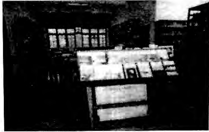
မေတ္တာနန္ဒ စာကြည့်တိုက်

ဤကောလိပ်သည် ဆရာဖြစ်သင် ကောလိပ်ကျောင်းမျိုးဖြစ် ၍ ခေတ်ကာလအရ လိုအပ်ချက်များရှိနေသော အင်္ဂလိပ်စာ၊ သင်္ချာ၊ ကွန်ပျူတာစသော ဘာသာရပ်များအပြင် ခေါင်းဆောင်သင်တန်းများ (leadership skill)၊ ဗုဒ္ဓနည်းကျ စီမံခန့်ခွဲမှု သင်တန်းများ (management skill) အပြင် စာပေရေးသားခြင်းဆိုင်ရာ ပညာရပ် များ၊ စဉ်းစားတွေးခေါ်ခြင်းဆိုင်ရာ ဘာသာရပ်များ၊ သတင်း၊ မီဒီယာ