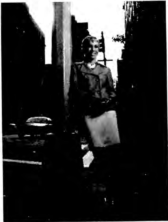
ဘာဘရာ ကော်ကိုရန်

ဘာဘရာ ကလေးဘဝတုန်းက အဖြစ်အပျက်တစ်ခုရှိတယ်။ သူတို့ ရုပ်ကွက်ထဲက မစ္စက်ကာဆီရောတီတို့အိမ်က အုတ်တံတိုင်း အသစ်လုပ် တယ်။ ဘာဘရာက တံတိုင်းသစ်ကို မျက်စိကျတယ်။ တံတိုင်းသစ်က ဘီလပ်မြေစိုစို။ တုတ်ချောင်းကြီးကြီးနဲ့ လတ်လတ်ဆတ်ဆတ် တံတိုင်းသစ် ပေါ်မှာ ဘာဘရာ က BARBARA CORCORAN လို့ သူ့နာမည်ကို စာလုံး ကြီးကြီးနဲ့ ရေးချလိုက်တယ်။ ဘာကြာမှာလဲ။ သူ့အမေသိတော့ ဆူတာပေါ့။