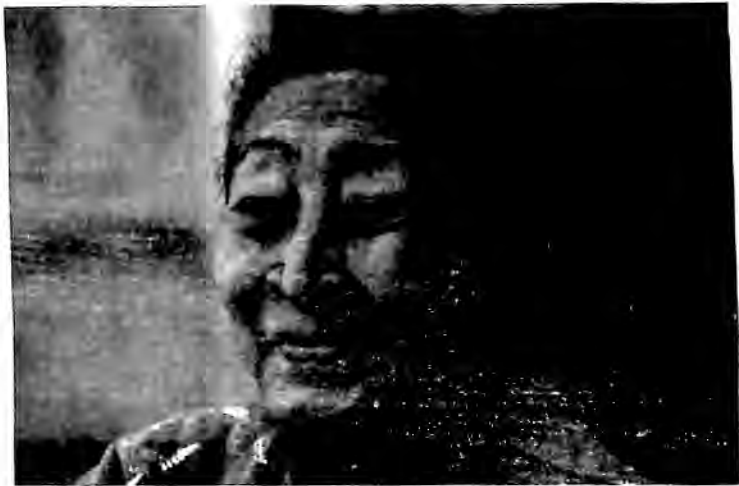
အမေ လူထုဒေါ်အမာ

တည်နိုင်ရုံသာမက သူနဲ့နီးနွယ်ပတ်သက်ရာ စာပေသမား လူငယ်လူရွယ် တွေကို ကိုယ့်ကလောင် ကိုယ်တန်ဖိုးထားတတ်အောင်၊ စိတ်ဓာတ်ကြည်လင် သန့်ရှင်းအောင် တတ်နိုင်သမျှ စည်းရုံးစွမ်းဆောင်နိုင်သူမျိုးပါ။ ဒီအစွမ်းက လူတိုင်းမှာ မရှိပါဘူး။ သူတစ်သက်လုံး ဖြတ်သန်းလာခဲ့တဲ့ သမိုင်းစင်ကြယ် ခြင်း၊ ကိုယ်ရည်ကိုယ်သွေး သန့်စင်ခိုင်မာခြင်းနဲ့ ဆိုင်ပါတယ်။ လူ တစ်ယောက်က အခြားသူတွေကို အားဖြစ်စေနိုင်တယ်ဆိုတာ ငွေနဲ့ ဝယ်ယူလို့ မရနိုင်သလို အာဇာနည် စေခိုင်းလို့လဲ မရတဲ့အရာပါ။