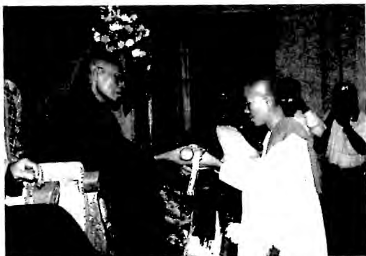
M.A (B.Dh) ဘွဲ့ယူစဉ်

သီလရှင် (ပထမ)။ အစိုးရ အဘိဓမ္မာ (ဂုဏ်ထူးဆောင်) နှစ်ချင်း သုံးဆင့်အောင်