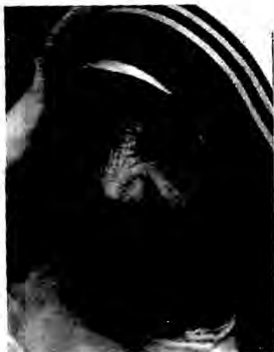
မာသာထရီစာ

မိဘမဲ့ကလေးတွေကို ပြုစုစောင့်ရှောက်ဖို့ (The Nirmala Shishu Bhavan, the Children's Home of the Immaculate Heart, as a heaven for orphans and homeless youth.) အိမ်တစ်ဆောင်ကိုလည်း ၁၉၅၅ ခုနှစ်မှာ ဖန်တီးခဲ့တယ်။ ၁၉၆၀ ခုနှစ်တွေ ဝန်းကျင်မှာတော့ အခမဲ့ဆေးရုံတွေ၊ မိဘမဲ့ဂေဟာတွေ၊ ကိုယ်ရေပြားရောဂါသည်တွေကို ကုသပေးဖို့ ဂေဟာတွေ စသည်ဖြင့် အိန္ဒိယပြည် နေရာအနှံ့မှာ ကြိုးစားဖွင့်လှစ်ပေးခဲ့တယ်။ အဲဒီနောက်ပိုင်း ၁၉၆၅ ကနေ ၁၉၇၀ ခုနှစ် အတွင်း ဗင်နီဇွဲလား (Venezuela)၊ ရောမ (Rome)၊ တန်ဇန်နီးယား (Tanzania)၊ ဩစတြေးလျ (Austria) စသည်ဖြင့် အာရှ၊ အာဖရိက၊ ဥရောပ၊ အမေရိကန် ပြည်ထောင်စု စတဲ့ နိုင်ငံဒါဇင်ပေါင်းများစွာ ဖွင့်လှစ်ပေးနိုင်ခဲ့ပါတယ်။ နှစ်ပေါင်း ၅၀ ကျော် လူသားထုကောင်းကျိုးကို ဆောင်ရွက်ပေးရင်း မွန်မြတ်လှတဲ့ အမျိုးသမီးကြီးဟာ ၁၉၉၇ ခုနှစ်၊ စက်တင်ဘာလ ၅ ရက်နေ့မှာ ကွယ်လွန်ခဲ့ပါတယ်။ သူကွယ်လွန်တဲ့အခါ တစ်ကမ္ဘာလုံးက လှိုက်လှိုက်လှဲလှဲ ဂုဏ်ပြုချီးကျူး