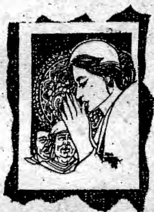
(၈) သားသမီးဟူသည်

“ရဟန်းတို့... ကောင်းစွာသိမြင်တတ်သော ပညာရှိ မိဘတို့သည် ငါတို့ မွေးမြူထားသော သားသမီးတို့သည် ငါတို့အား ပြန်လည်လုပ်ကျွေးကြလိမ့်မည်ဟူသော မျှော်လင့်ချက်ဖြင့် သားသမီး များကို အလိုရှိကြကုန်၏။ ထို့ကြောင့် ပြုဖူးသော ကျေးဇူးကို သိသော သူတော်ကောင်းတို့သည် ရှေးကပြုဖူးသည်ကို အပြန်ပြန်အောက်မေ့ လျက် မိဘတို့ကို ပြုစုလုပ်ကျွေးရာ၏”