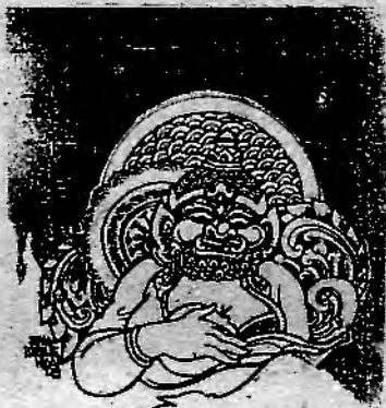
(၁) မိဘဂုဏ်ရည် စာပန်းချီ