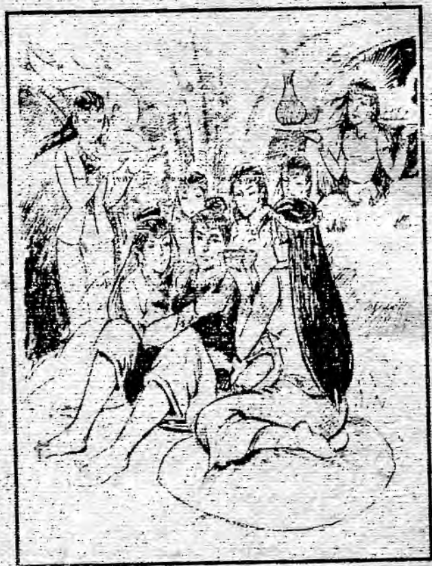
မိတ္တဝါဒကမင်းသား ပြိတ္တာမ (၇) ယောက်နှင့် ပျော်ပါးနေပုံ ကောင်းထွင်စာပေ