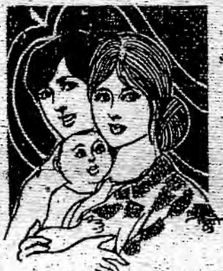
(၉) နှစ်မြာမိဘ လုပ်ကျွေးကြ