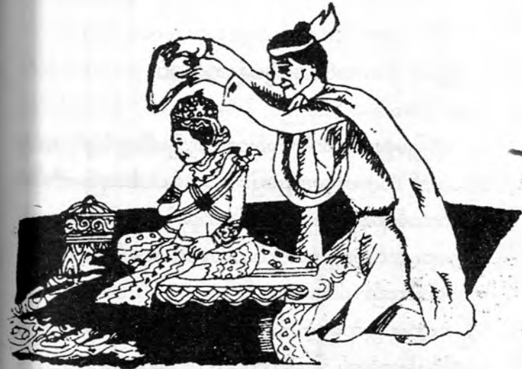
ချည်မန်းကွင်းစွပ်