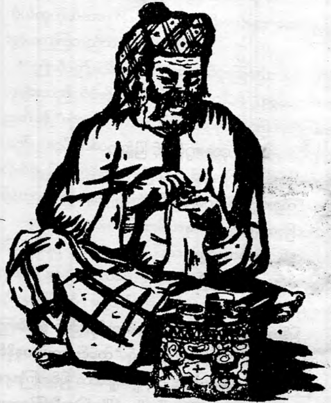
ကွမ်းနှင့်မြန်မာ