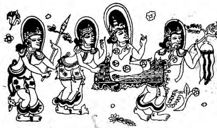
သာဝတ္ထိပြည်သူတို့ ရှင်ပြုမင်္ဂလာ