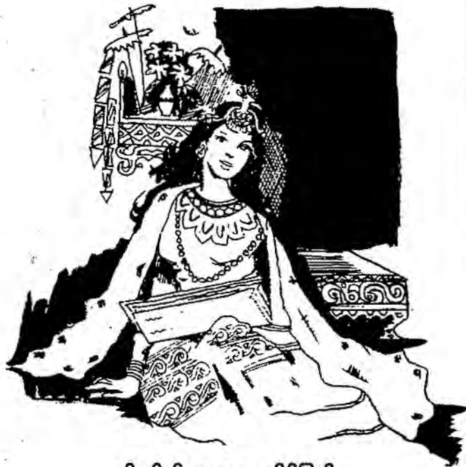
ရှိုးလိုက်ရတုအစ ရခိုင်ပြည်က