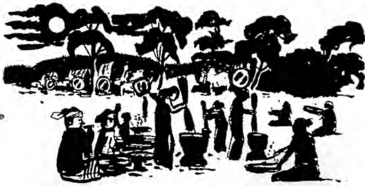
ရှင်ပြုမင်္ဂလာပွဲဖြင့် လူထုစည်းရုံး