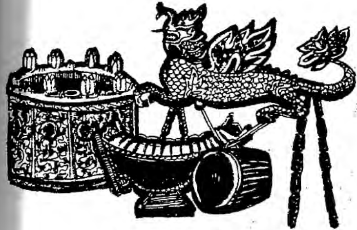
ရှင်ပြုမင်္ဂလာနှင့် စည်ပြော