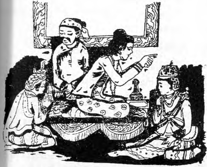
လက်ဖွဲ့ စာတိုက်ခန်း