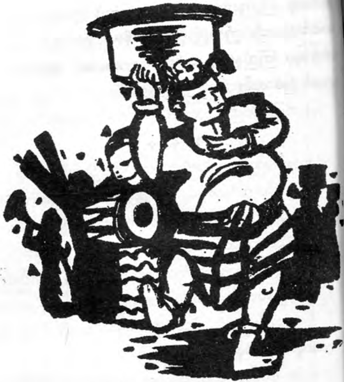
ရှင်ပြုမင်္ဂလာပွဲမှ ပျော်စရာများ