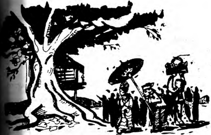
ရှင်လောင်းနတ်ပြ ကုသိုလ်ငှ