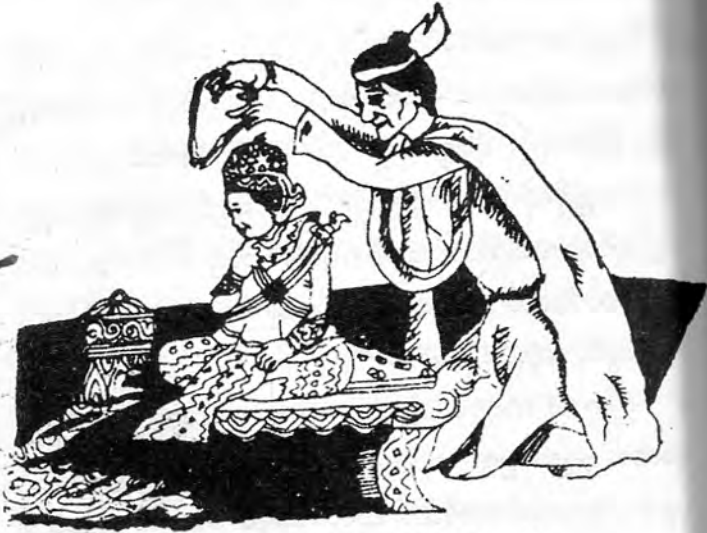
သာလွန်မင်းနှင့် မင်းကိုယ်ချည်