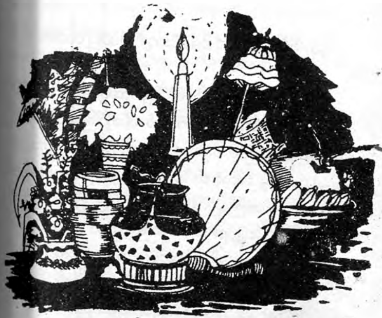
ရှင်ပြုမင်္ဂလာ စီမံခင်းကျင်းဖွယ်ပြု လက်က