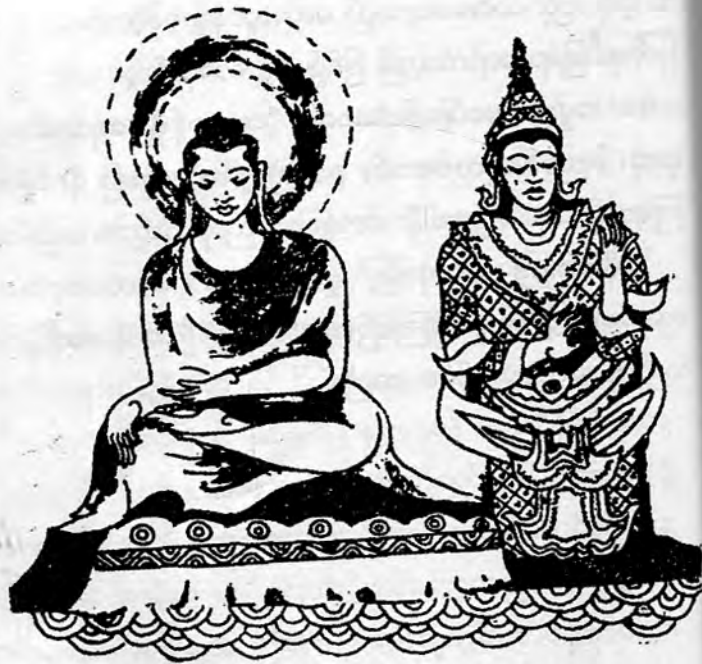
ရေစက်ချနှင့် ဝသုန္ဒရေနတ်သား