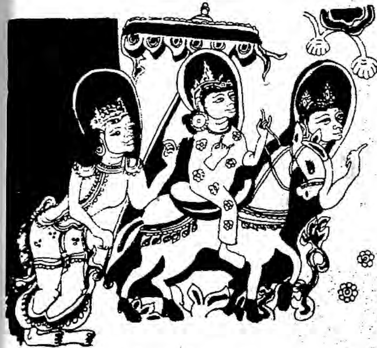
ပုဂံပြည်သူတို့၏ ရှင်ပြုမင်္ဂလာ