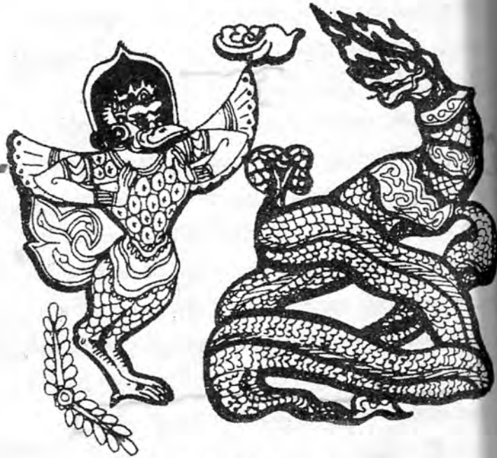
မင်းကိုယ်ချည်၏ အမွန်အစ