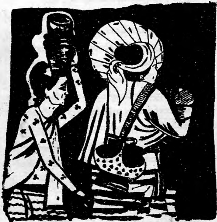
ဖမာ ယပ်ထမ်း တခန်း သပိတ်လွယ်