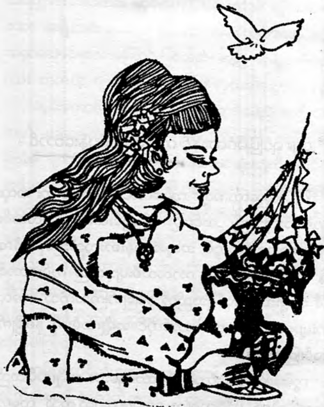
ရှင်ပြုမင်္ဂလာနှင့် ကွမ်းတောင်ပန်းတောင်