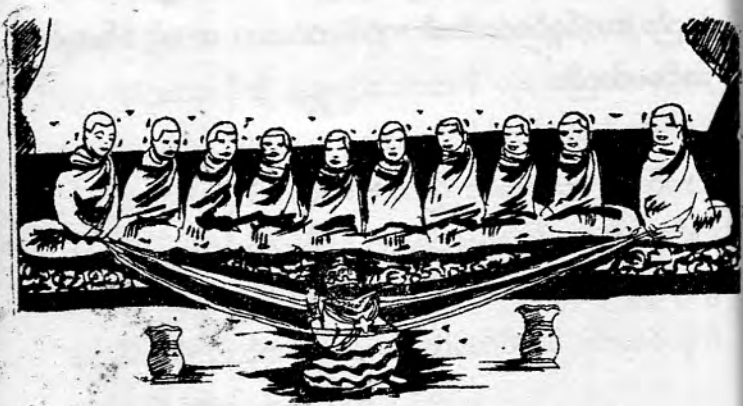
မင်းကိုယ်ချည်တွင်း ရှင်လောင်းသွင်း