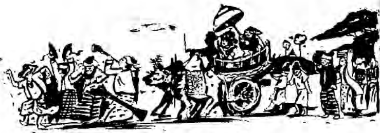
ရှင်လောင်း လှည့်ပွဲ