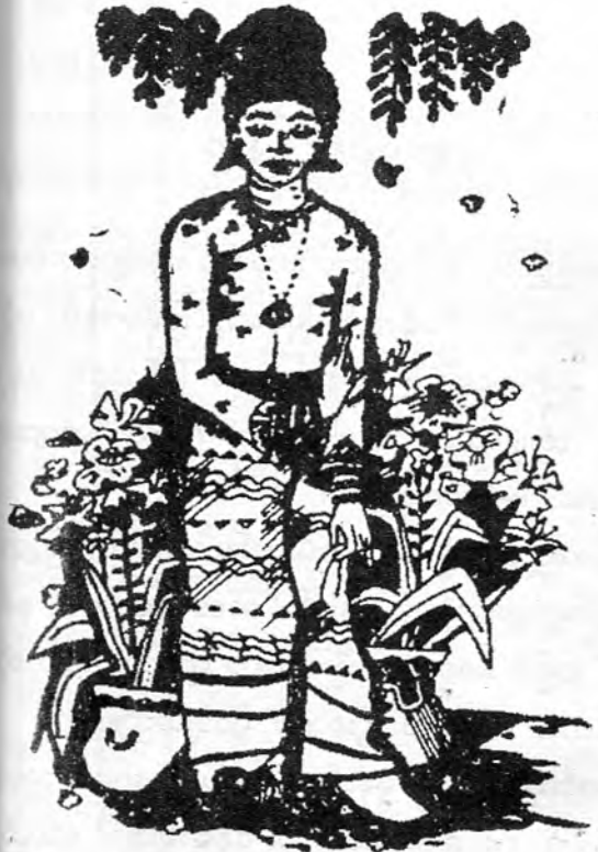
ပန်းနှင့်မြန်မာ