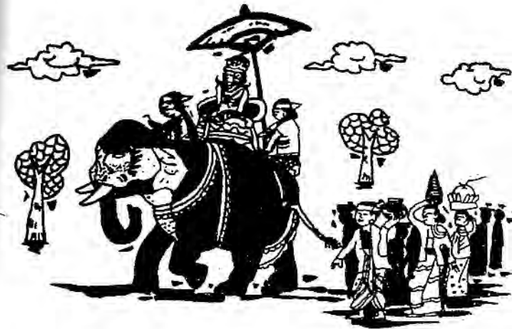
သရေခေတ္တရာ ပြည်သူတို့၏ ရှင်ပြုမင်္ဂလာ