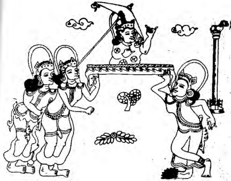
ရှင်ပြုမင်္ဂလာ အမွန်အစ