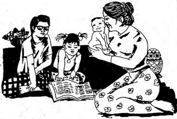
ရှင်ပြုမင်္ဂလာသည် မြန်မာ့လူမှုကို ဖော်ကျူး

၅။ ရှင်ပြုမင်္ဂလာသည် မြန်မာ့လူမှုကို ဖော်ကျူး