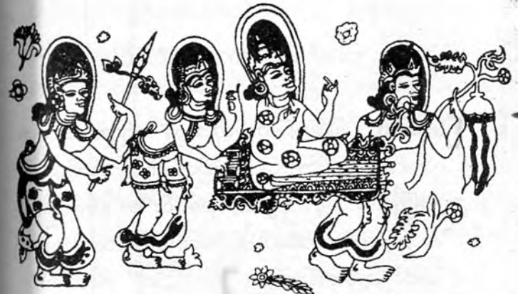
ရှင်ပြုမင်္ဂလာနှင့် ဝင်းခင်း