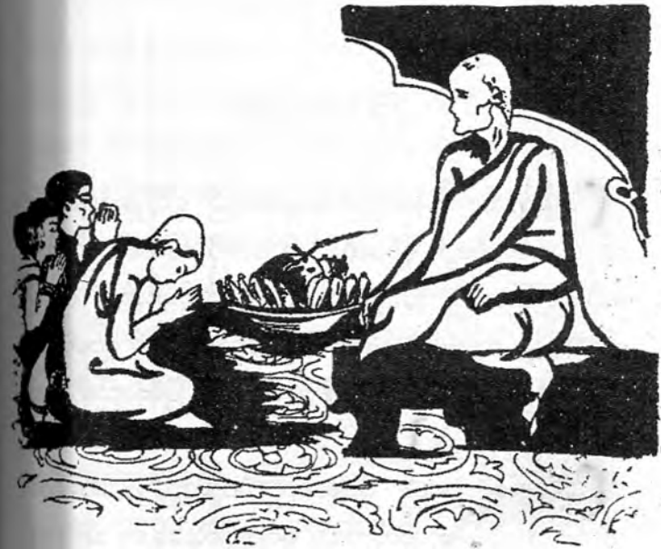
ရှင်မည်ခံပွဲ