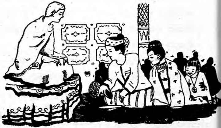
အလှူရေစက် လက်နှင့်မကွာ