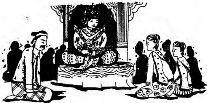
ရှိုးလိုက် စုံတွဲရတု