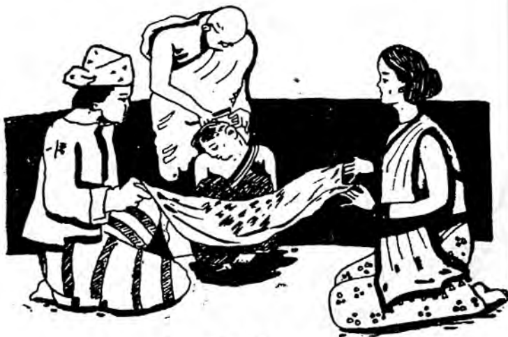
ရှင်လောင်းပြုပြင် အလှဆင်