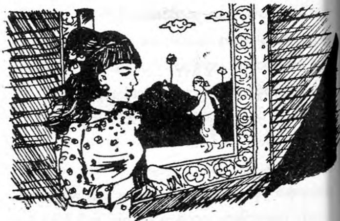
ပျိုတို့မောင် ရှင်လိင်ပြန်