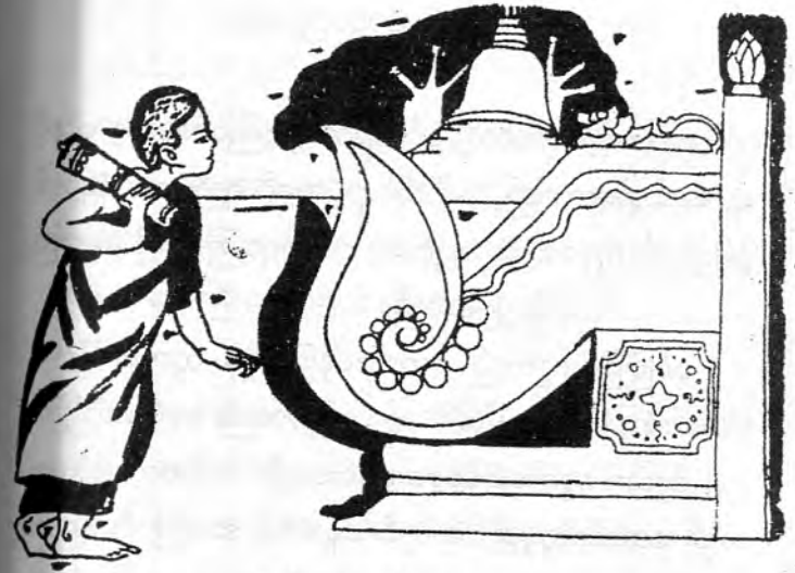
မပန်သာသည့် ပန်း