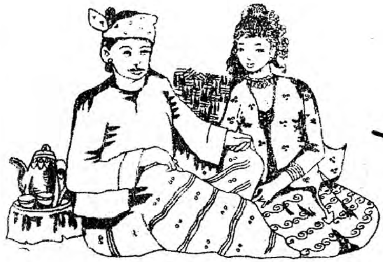
ဆွဲမှ ရွဲသို့