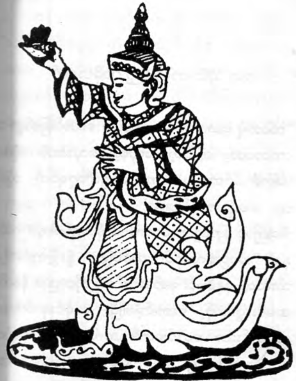
ဆိုင်း ကပ်သည့် လမိုင်းနတ်