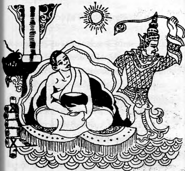
ထေရ်ဘုန်း ဥပဂုတ် ရန်ငုတ်ကြည့်ပ