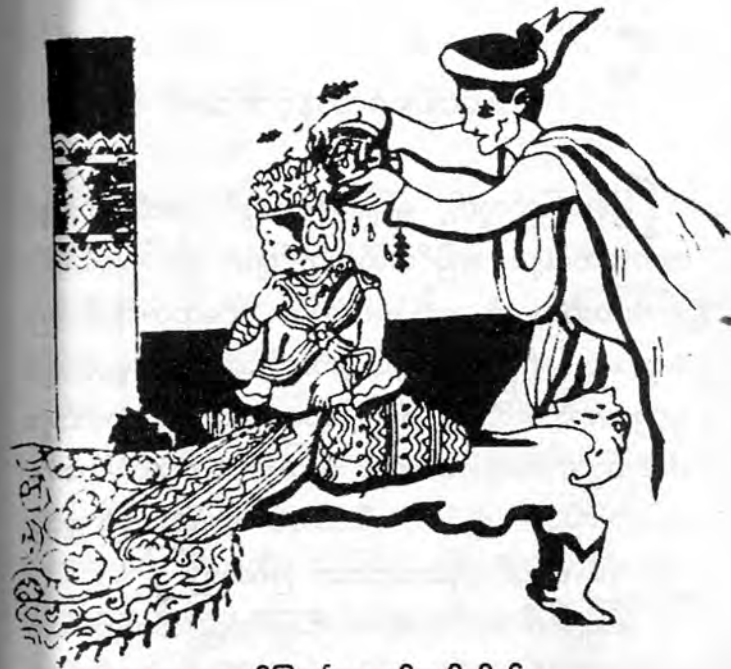
ရှင်ပြုမင်္ဂလာနှင့် ဘိသိက်