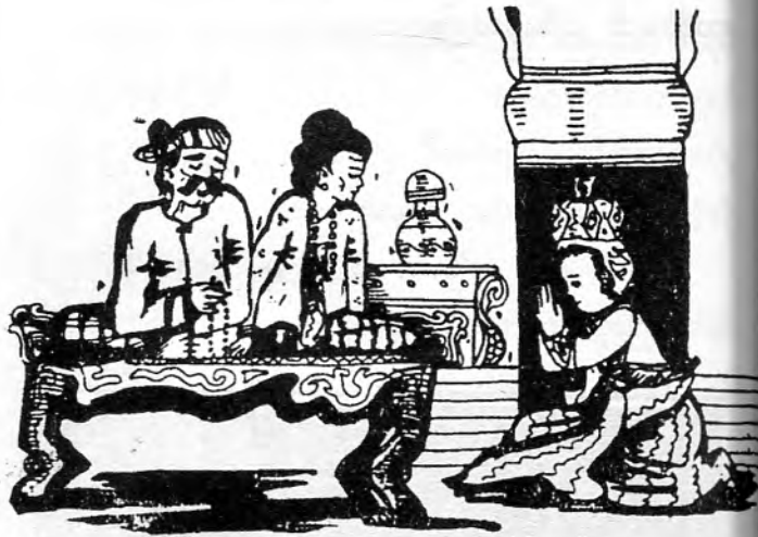
ဘိသိက်မင်္ဂလာနှင့် ကန်တော့ခန်း