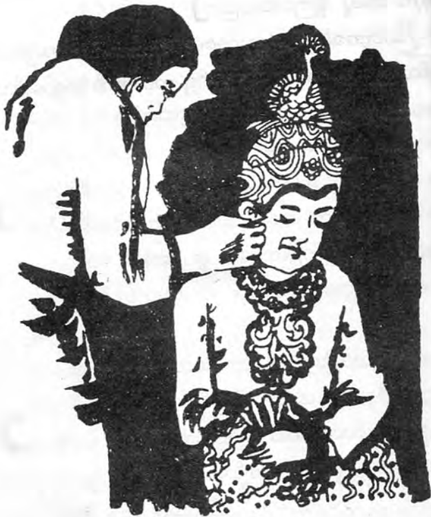
နားသမင်္ဂလာ