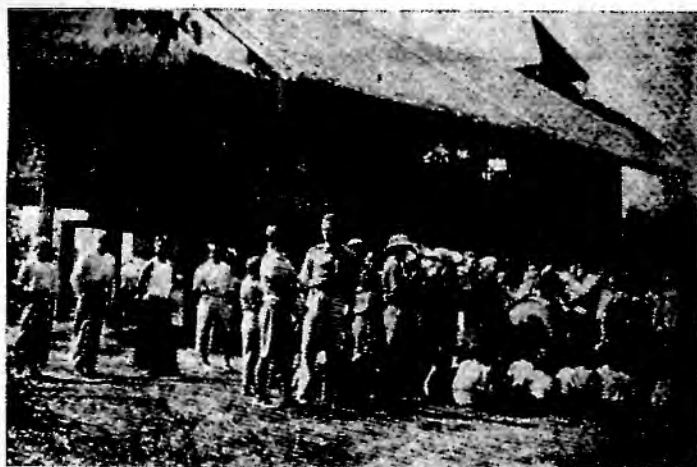
မိုလ်ကိတ်ကျောင်း ဘင်ခရာတူရိယာအဖွဲ့ တရားဟောထွက်ကြပုံ။