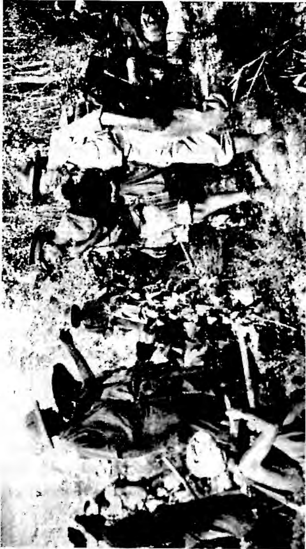
ပိုလ်ကံတံကြီး၊ မေဂျာပေါလ်ဂျိုးစ်နှင့် ဂျင်နရယ်စတီဝဲလ်တို့၊ ဒုတိယကမ္ဘာစစ်ကြီးအတွင်းက။