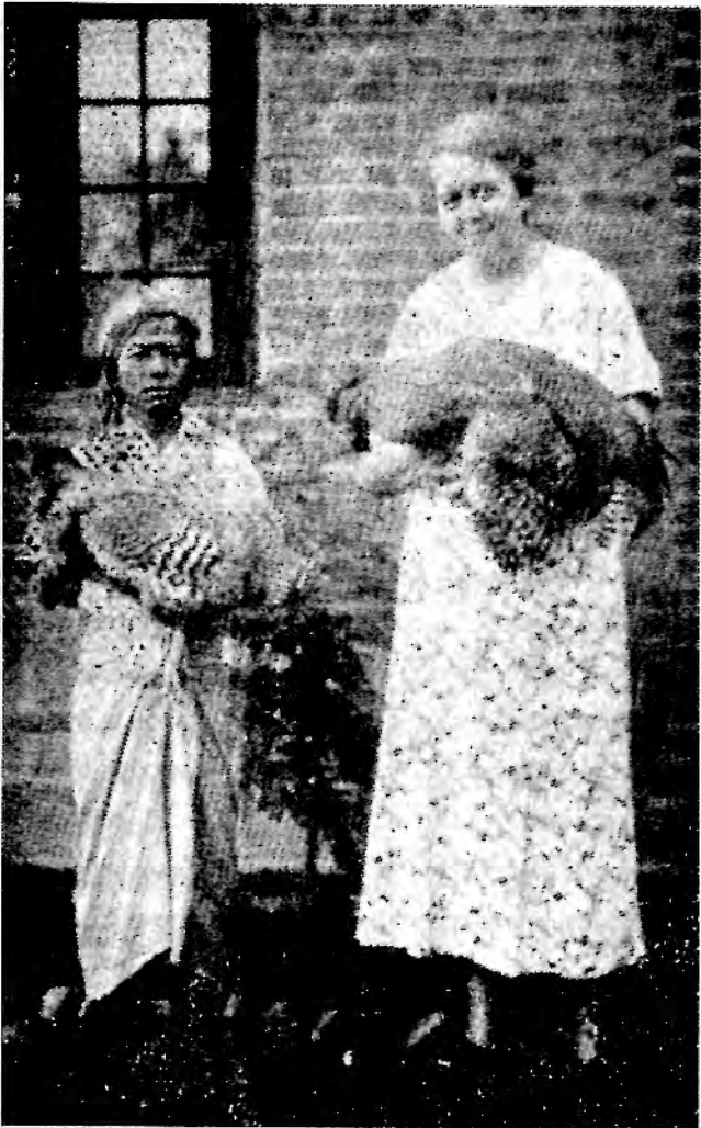
မိုလ်ကိတ်ကတော်ကြီးနှင့် မိုလ်ကိတ်ကြက်။