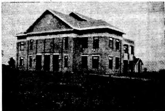
ပျဉ်းမနား စိုက်ပျိုးရေးသင်တန်းကျောင်း။