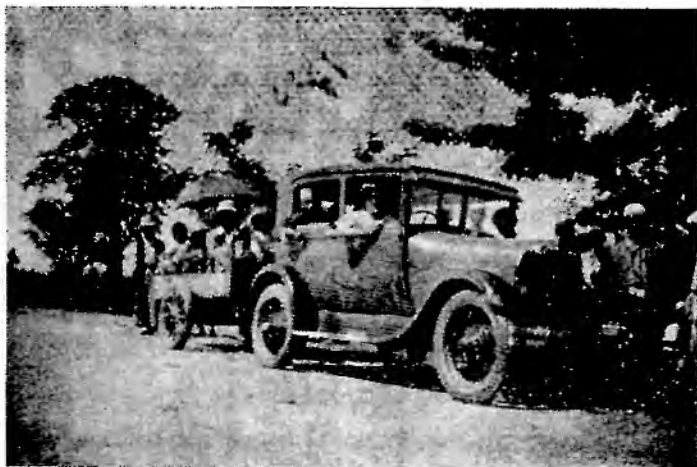
မိုလ်ကိတ်ကြီး တောထွက်ပုံ။