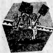
လိုတ်လဲစွာကြိုဆိုသူများ

စိမ်းစိုညိုမှိုင်း၍ ရုတ်တရက်အားဖြင့် ကြည့်လိုက်သော် ဟင်းသောက်ပန်းကန်လုံးကြီးတစ်လုံးကို ရေပေါ်တွင်မှောက်၍ ထားဘိသကဲ့သို့ မှတ်ထင်ရသော ကျွန်းတစ်ကျွန်းကို နံနက် ဆယ်နာရီသာသာခန့်တွင် ကျွန်ုပ် တွေ့မြင်ရပေ၏။