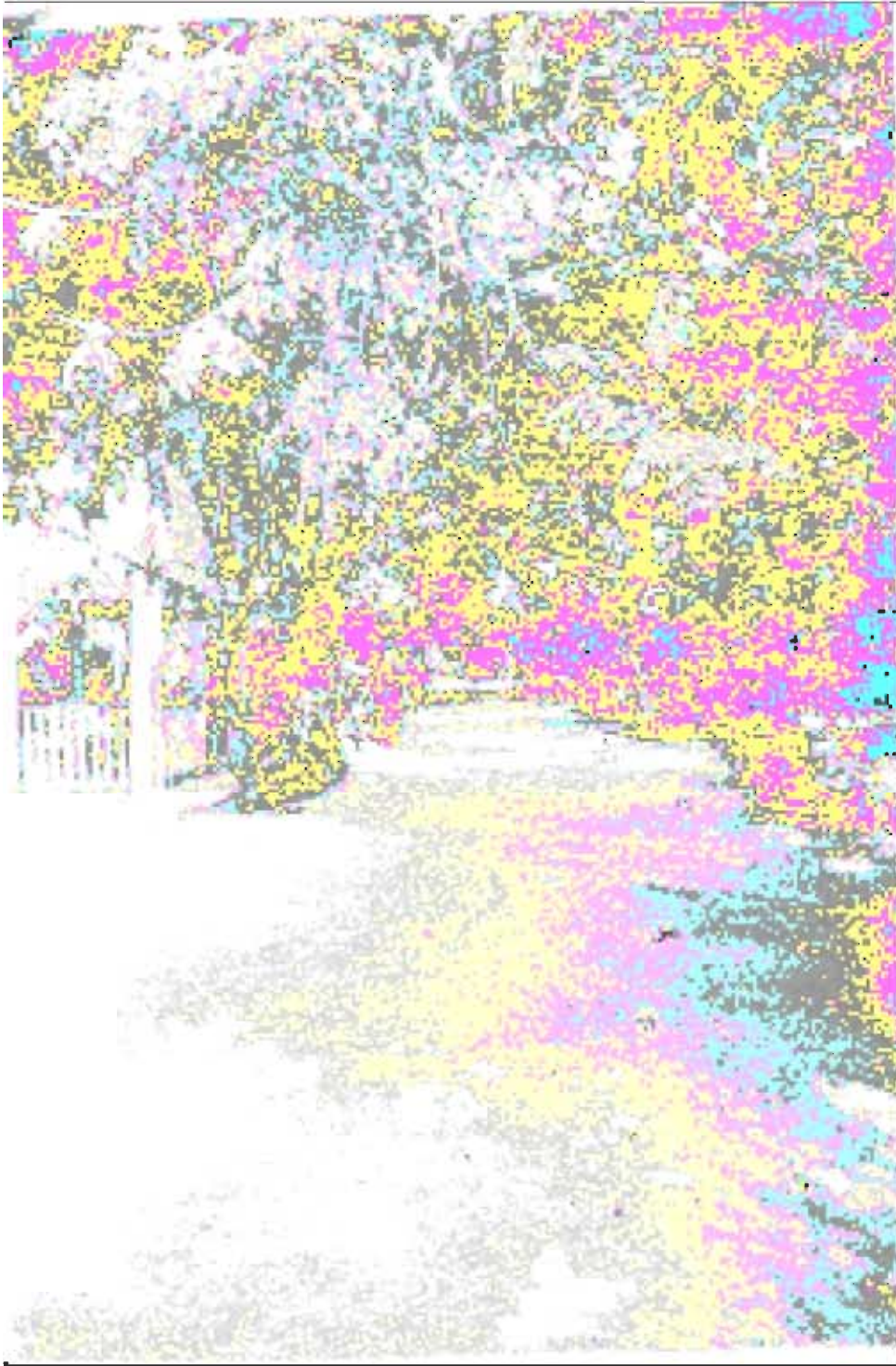
ထိုင်းနိုင်ငံ ချန်ဘူရီမြို့ရှိ ချန်ဘူရီ ဝိဝေကအာစုံ ဝိပဿနာ ကျောင်းတော်ကြီးသည် ဆိတ်ငြိမ် အေးချမ်းလှသည်။