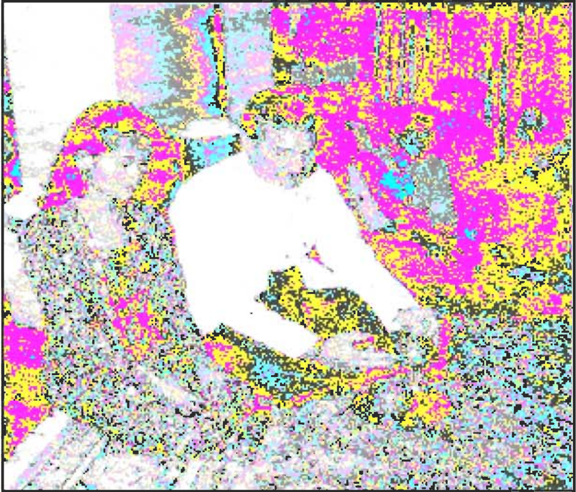
မြန်မာအမျိုးသမီးလေးအား လက်ထပ်ယူပြီးနောက် အလှူရေစက် လက်နှင့်မကွာ ရှိနေသော မစ္စတာ ပက်ဂျိန်း