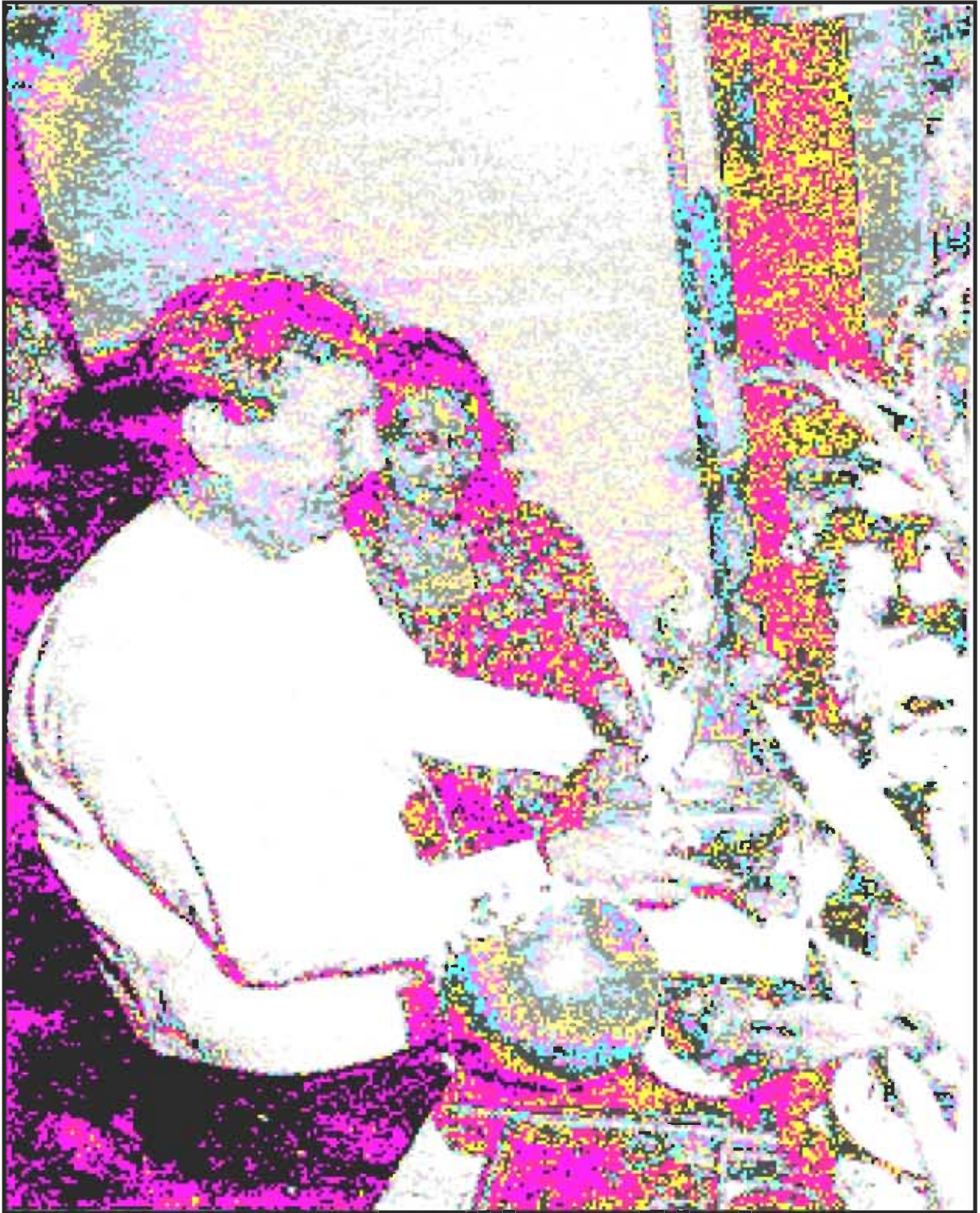
သံသရာအဆက်ဆက် မပျက်သောမေတ္တာနှင့် ပေါင်းရပါစေသားဟု မြတ်စွာဘုရားထံတွင် ဆွမ်း သစ်သီး ကပ်လှူပူဇော်၍ မတင်တင်လှိုင်တို့ ဇနီးမောင်နှံ ဆုတောင်းနေကြစဉ်