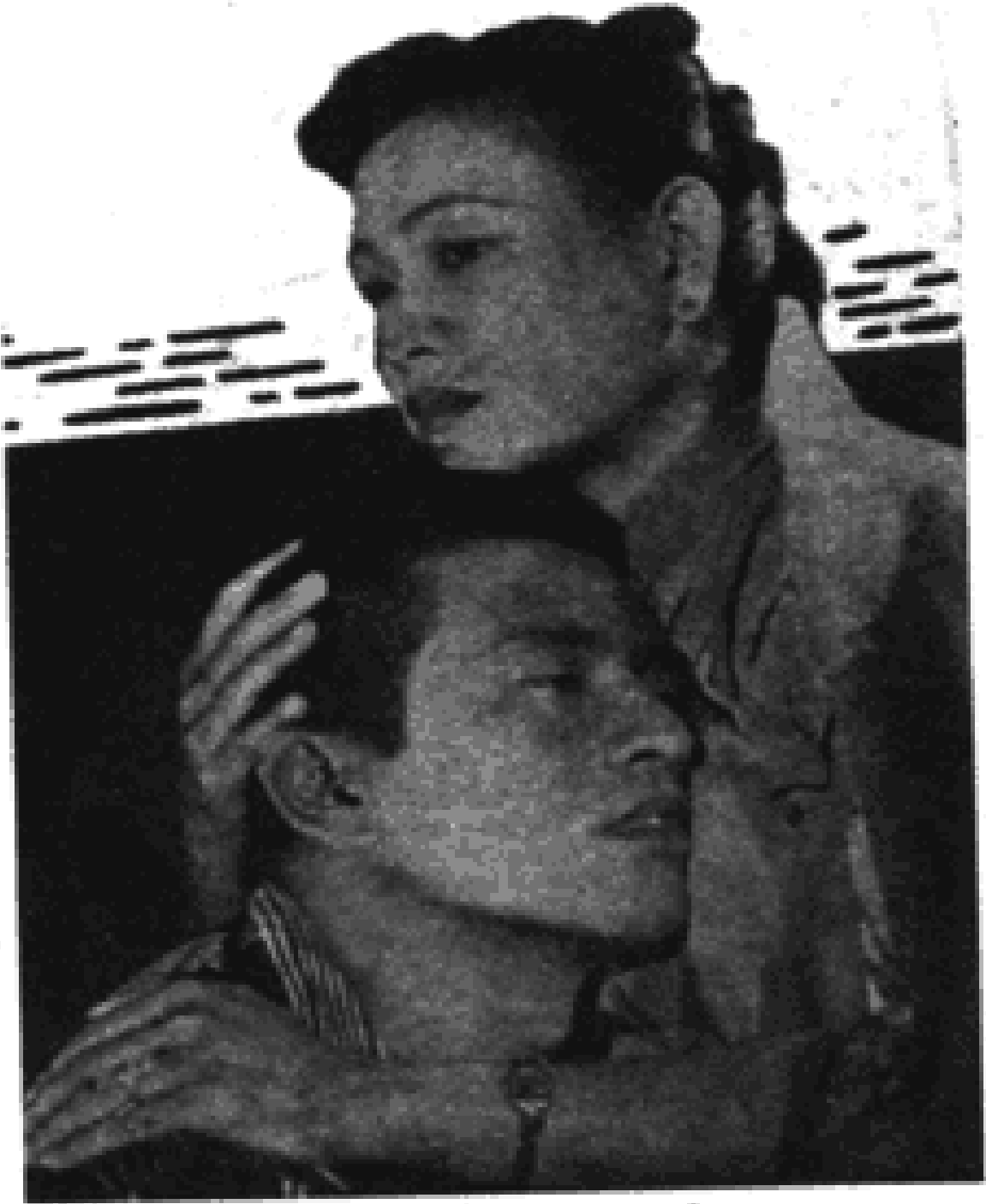
ခင်မာမာ နှစ် ခုခင်