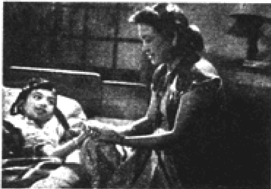
ဇေယျာ နှင့် ကလေးသရုပ်ဆောင်