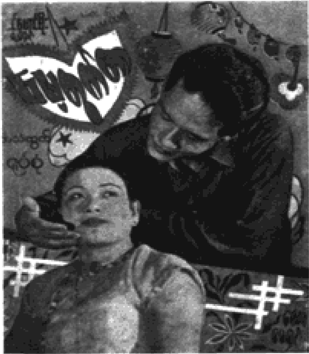
လေးယု နှင့် မေရင်