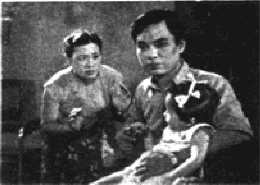
ဘသစ် နှင့် မေရင်