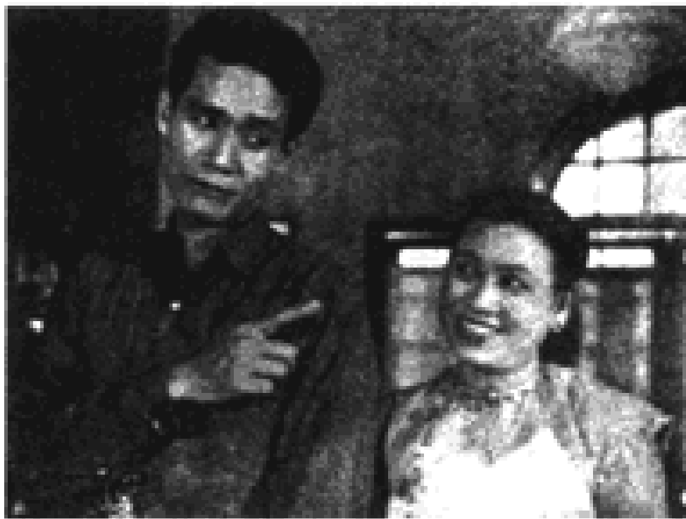
မောင် နဲ့ မေရင်