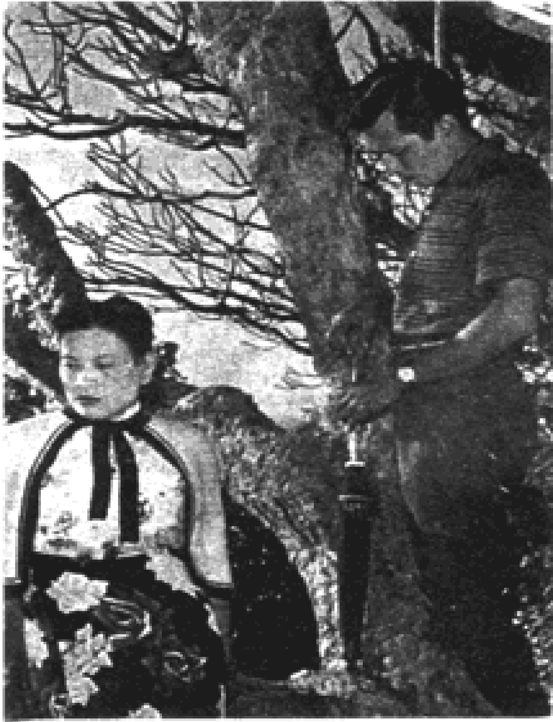
ကျော်ဆွေ နှင့် မေရှင်