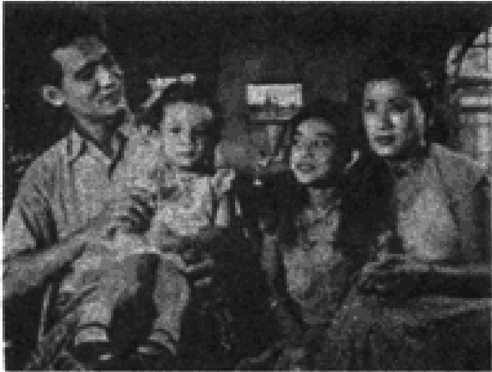
မောင် နဲ့ မေရင်