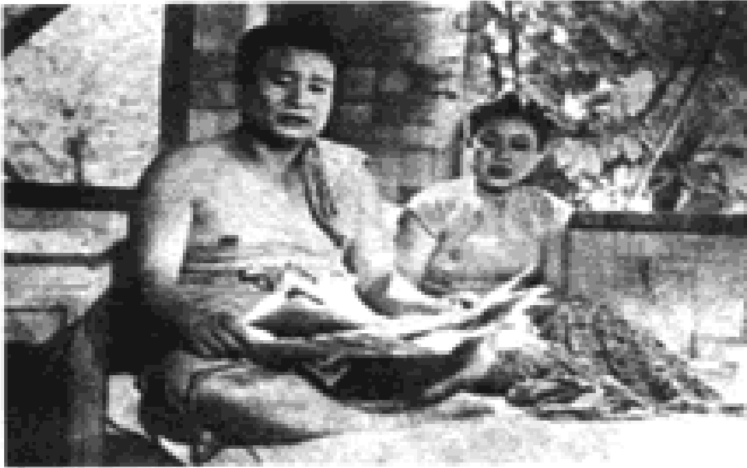
သာဂေါင် နှင့် မေရှင်