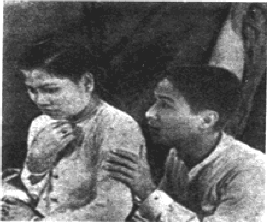
မေရှင် နှင့် မောင်တင်မောင်