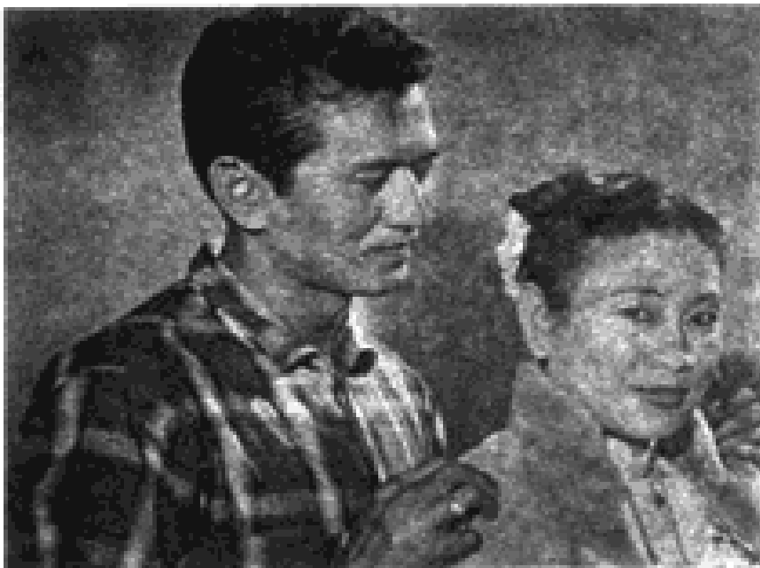
ကျော်ဆွေ နှင့် မေရှင်