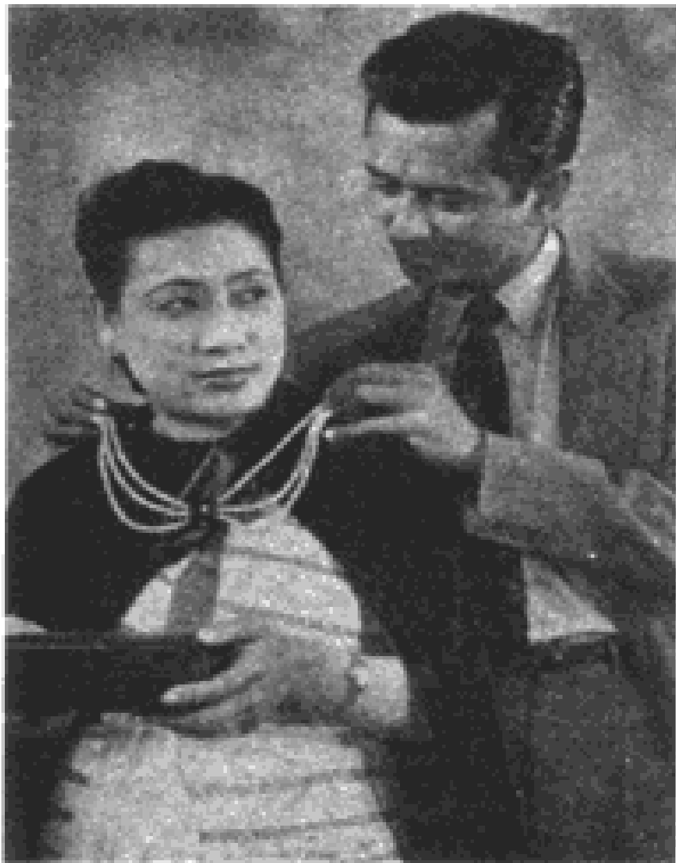
တော်တော်နှင့် ချစ်ခင်