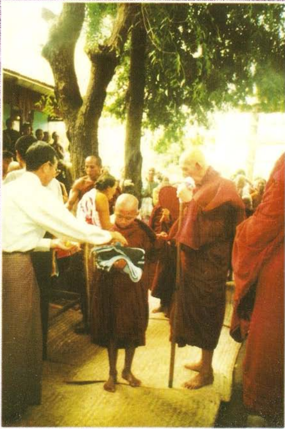
မြေဇင်းတောရဆရာတော်ဘုရားကြီး (၈၃) နှစ်မြောက်မွေးနေ့တွင် သာမဏေများအားလှူဒါန်းနေစဉ်