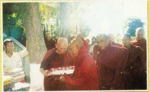
မြေခင်းတောရုဏရာတော်ဘုရားကြီး ပင့်သံဃာတော်များအားလှူဒါန်းနေစဉ်