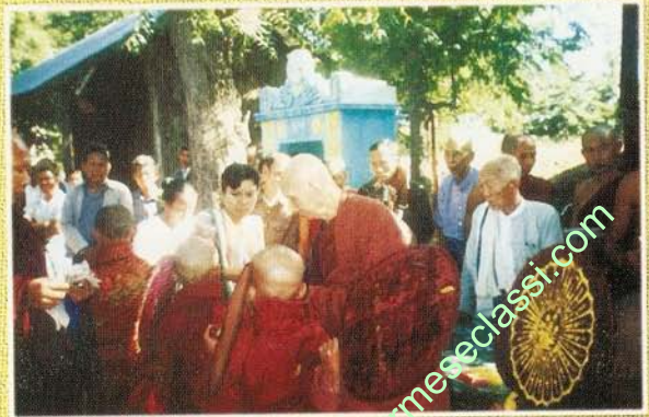
၈၃ နှစ်မြောက်မွေးနေ့လွှဲင် မြေခင်းတောရ ဏရာတော်ဘုရားကြီး သာမဏေများအားလှူနေစဉ်