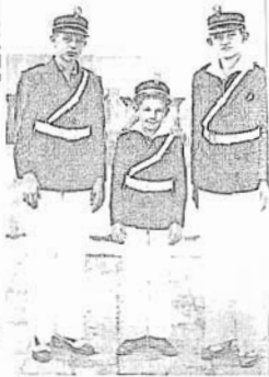
မူလတန်းအတန်း၊ဘေးဘဝကက်စ်ထို