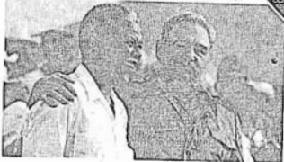
မင်းဗိုလားနှင့် ကက်စ်ထရီ