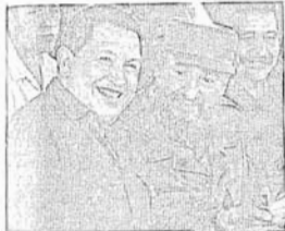
ဟုတ်နှင့် ကက်စ်ထရီ