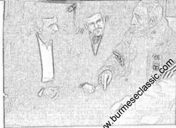
အဟာတ်နီနှင့် ကက်စ်ထရီ