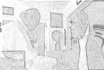
ပုဂံတစ်ခင်းကြီး ဝေရ်စစ်နှင့် ကက်စ်ထရီ