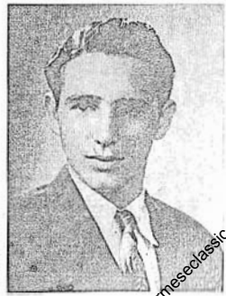
ဆွေငွေပုနှစ်က ကက်စ်ထရီ