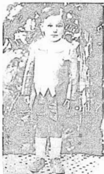
ထိုအခါကကက်စ်ထို