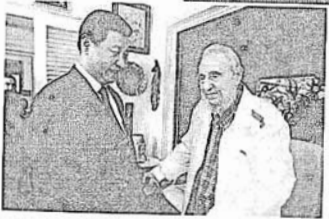
ဂျိုဂျွန်ဖွန်နှင့် ကက်စ်ထရီ