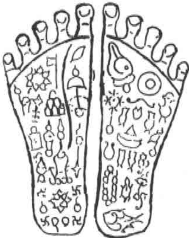
ခြေရာတော်