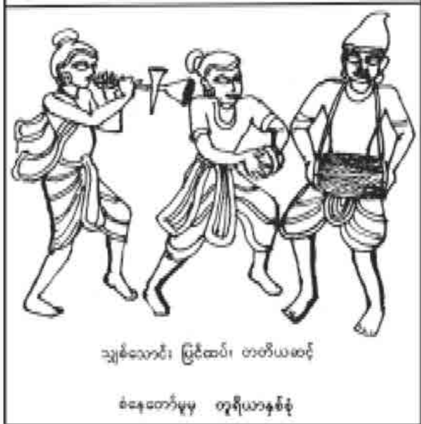
သျှစ်သောင်း၊ မြိုင်ထပ်၊ ဗာဗီယဆင့်